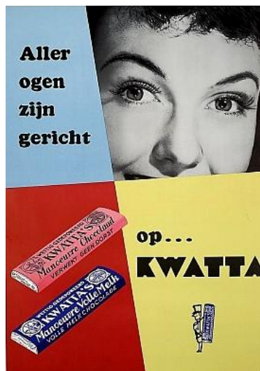
Kwatta reclame - jaren 60